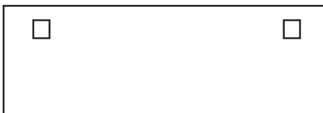
Top View of #1060 Shelf / Vista superior del estante No. 1060 / Vue du haut de la tablette n° 1060

Converts #1031 3-Gallon Cabinet, to accommodate a #175 5-Quart Sharps Container