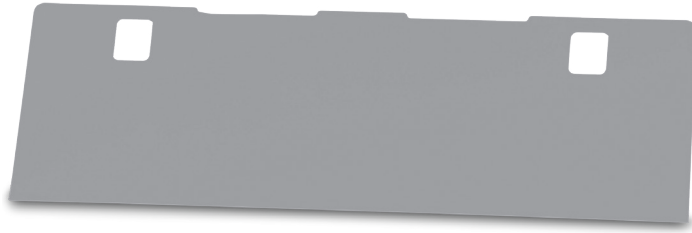
#1031 Cabinet / Gabinete No. 1031 / Armoire n° 1031

#1060 Shelf / Estante No. 1060 / Tablette n° 1060